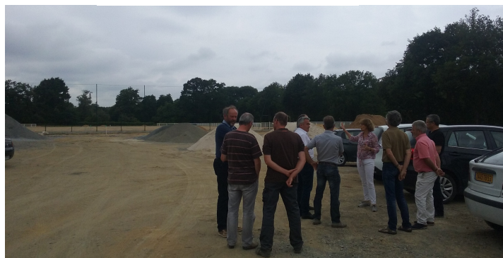
Visite du site pour l'aménagement d'une nouvelle passerelle au GENEST ST ISLE