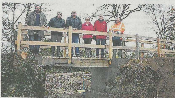
La nouvelle passerelle en bois a été installée cette semaine.

Le chemin de randonnée de la Troitière reliant La Cropte à Meslay-du-Maine, Saint-Denis-du-Maine et la route de Sablé, a été le centre de travaux. Une nouvelle passerelle a été installée sur un ouvrage maçonné refait à neuf.