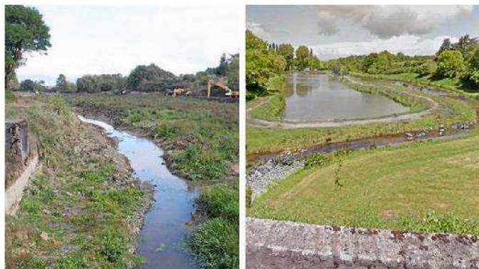
Photomontage de ce que pourrait être le plan d'eau en fin d'année 2017. |

Le projet de renaturation du plan d'eau entre dans sa deuxième phase. L'enquête publique, qui a eu lieu au cours du premier semestre 2016, a donné son feu vert : 308 000 € sont engagés.